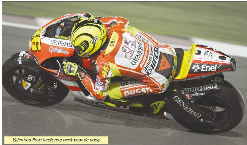
Valentino Rossi heeft nog werk voor de boeg.

125CC : 1.Nicolas Terol (ES/Aprilia) 2.Sandro Cortese (DE/Aprilia) 3.Sergio Gadea (ES/Aprilia) 4.Efren Vazquez (ES/Derbi) 5.Jonas Folger (DE/Aprilia) 6.Johann Zarco (FR/Derbi) 7.Alberto Moncayo (ES/Aprilia) 8.Luis Salom (ES/Aprilia) 9.Maverick Vinales (ES/Aprilia) 10.Miguel Oliveira (PT/Aprilia) 11.Hector Faubel (ES/Aprilia) 12.Jasper Iwema (NL/Aprilia) 13.Danny Kent (UK/Aprilia) 14.Simone Grotzkyj (IT/Aprilia) 15.Louis Rossi (FR/Aprilia). MOTO2 : 1.Stefan Bradl (DE/Kalex) 2.Andrea Iannone (IT/Suter) 3.Thomas Luthi (CH/Suter) 4.Alex De Angelis (SM/Motobi) 5.Yuki Takahashi (JP/Moriwaki) 6.Simone Corsi (IT/FTR) 7.Jules Cluzel (FR/Suter) 8.Michele Pirro (IT/Moriwaki) 9.Bradley Smith (UK/Tech